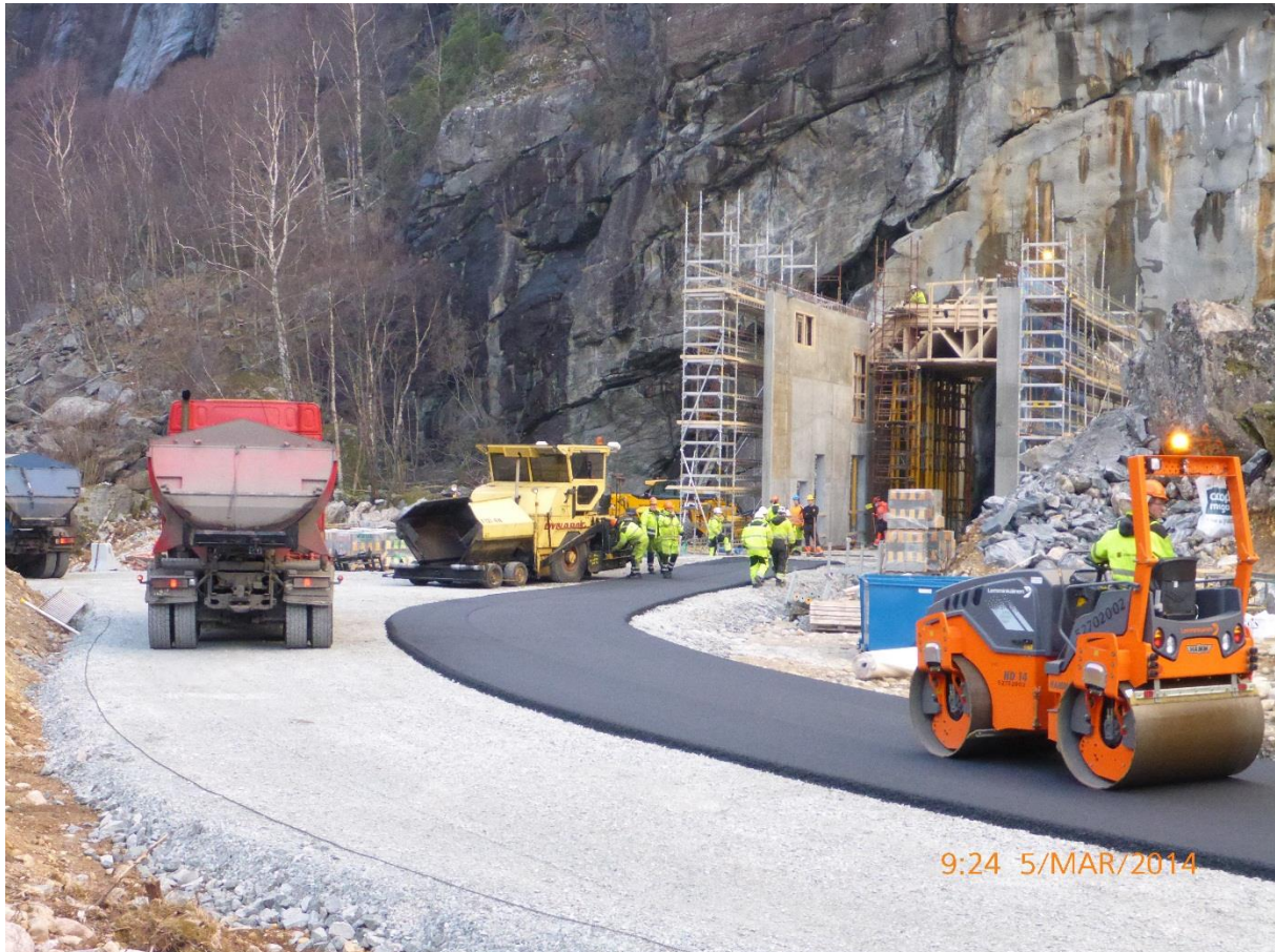
Asfalteringsarbeider og betongarbeider foran adkomsttunnelen til kraftstasjonen

De siste dagene med store nedbørsmengder har dessverre overvannet fra fjellsiden tatt med seg grus og sand ned på enkelte av eiendommene nærmest den midlertidige transportvegen ned til sjøen. Opprydding vil bli gjort så snart værforholdene tillater det. Lyse beklager de ulempene dette har medført for de enkelte naboene. Lyse vil kontakte de enkelte naboene før arbeidene starter.