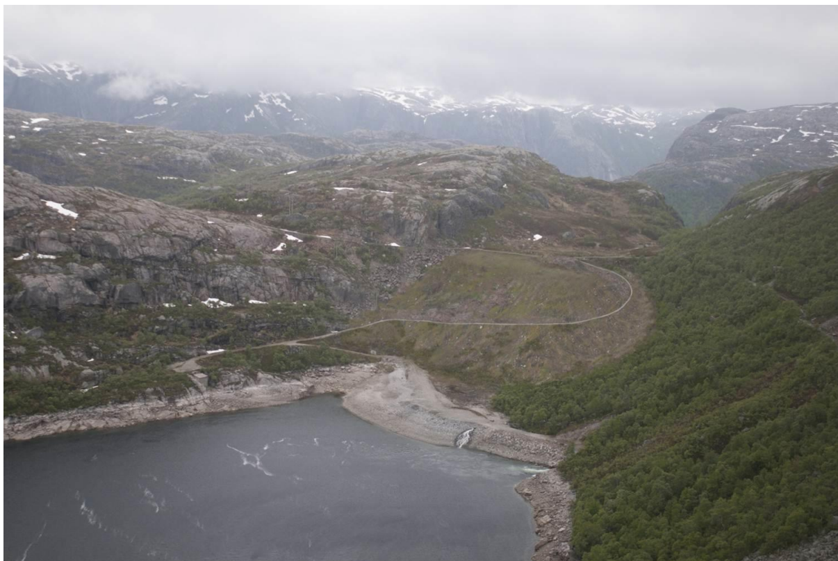
Planlagt deponi ved Strandvatnet

Anleggsarbeidene ved Strandvatnet vil starte opp med tilrigging av brakker og øvrige installasjoner så snart snøforholdene tillater det. Planen er å starte sprengningsarbeidene på tunnelene på forsommeren. Stein fra tunnelene vil bli lagt på land i et permanent deponi ved sydvestre del av Strandvatnet.