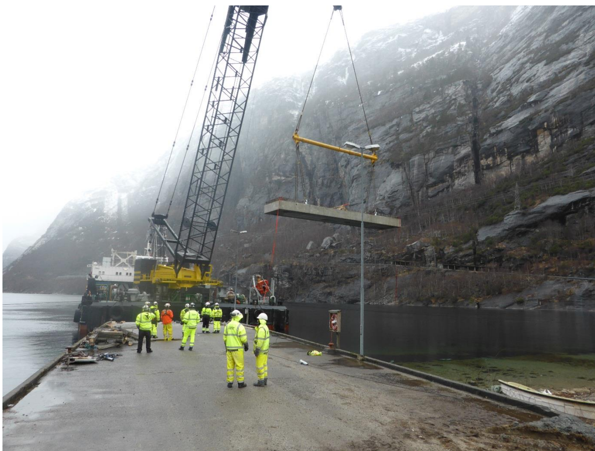
Løfting av kaelement på ca. 100 tonn

Forberedende arbeider for nytt stort kraftverk i Lysebotn nærmer seg slutten. Det er mye arbeid som er gjort siden start i fjor sommer. I løpet av høsten 2013 ble anleggsveien fra Lysebotn inn til Strandvatnet ferdig rustet opp med nye møteplasser, ny asfalt og mer rekkverk. I Lysebotn er de første 30 m av adkomsttunnel ferdig sprengt og det er støpt en ca. 30 m lang betongkulvert i tilknytning til adkomsttunnelen. Den gamle anleggskaie er rustet opp med ny front og nye fortøyningspullerter på land.